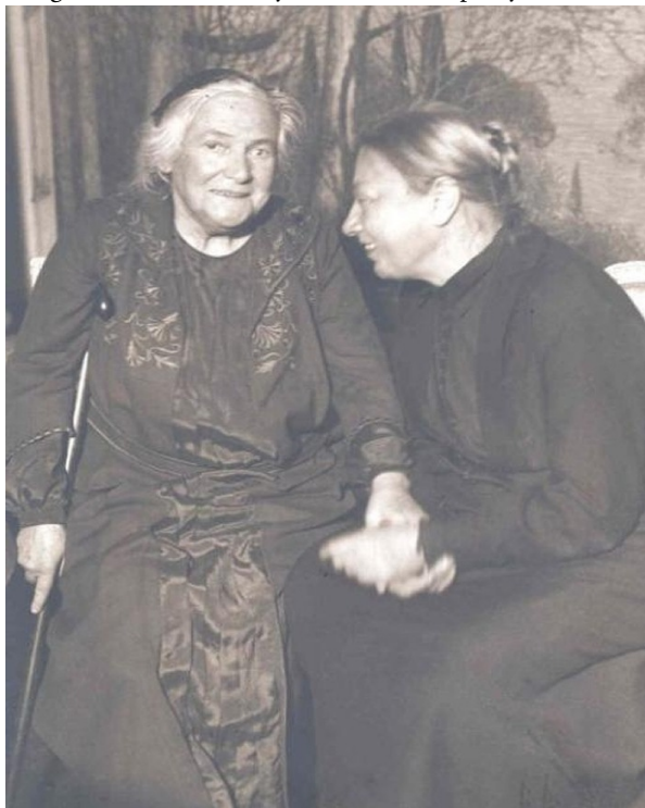
Imagen 2. Clara Zetkin y Nadezhda Krupskaya, 1927.