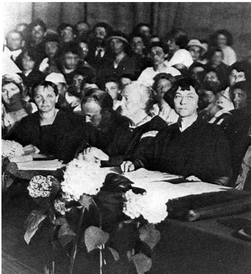
Imagen 3. Alexandra Kollontai (a la derecha) y Clara Zetkin (a la izquierda), 1921.