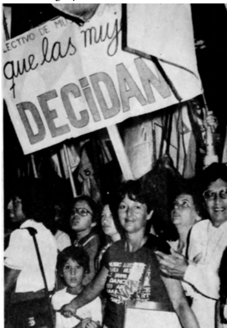
Figura 1. Marcha 8 de marzo 1985. Montevideo, Uruguay.