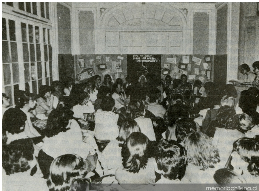
Figura 3. Círculo de Estudios de la Mujer, Chile, 1938