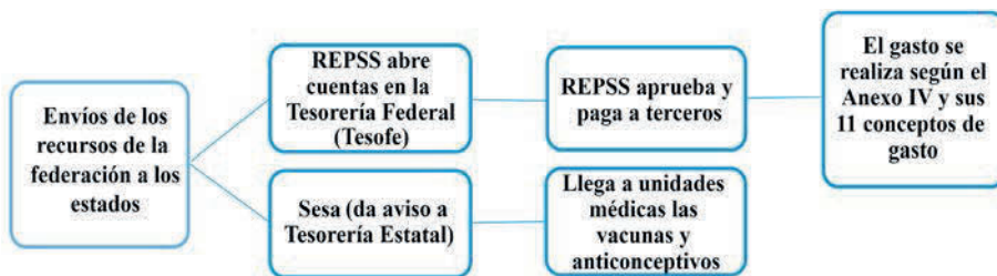
Figura 1. Rendición de Cuentas en el Acuerdo de coordinación.

REPSS: Regímenes Estatales de Protección Social en Salud, tienen que informar a SS en tres días hábiles montos, fechas e importe de rendimientos.